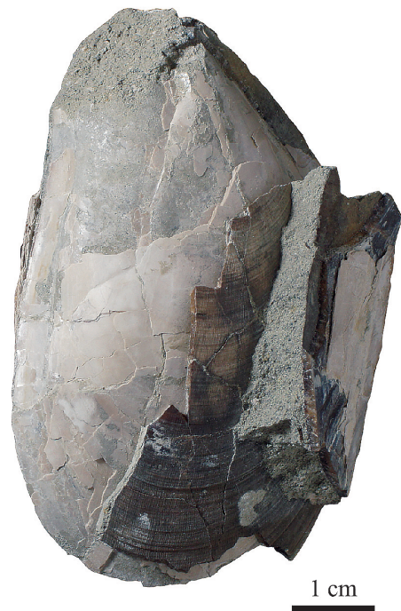
Fig. 1. 分析に用いた Crenomytilus grayanus (Dunker, 1853), MFM13000.

微量元素比 (Ca に対する Li, Mg, Mn, Sr, Ba のモル濃度比) は海洋研究開発機構の四重極型 ICP-MS (iCAP-Qc, Thermo Fisher Scientific) を用いて測定した。Sr 同位体比の測定に用いたクリーニング済みの粉末試料をおよそ 100 g 秤量し, 測定溶液の Ca 濃度が 10 mg/L となるように 0.3 mol/L 硝酸を添加して半日以上室温で反応させた。検量線についても溶液の Ca 濃度を 10 mg/L で一定とし, 測定対象とする微量元素の ICP-MS 用単元素標準液を混合することで調整した。また, Be, Sc, Y, Tl を内標準として硝酸に添加することで測定時の感度ドリフトを補正した。得られた微量元素比は, 産業技術総合研究所発行の炭酸塩標準試料 JCp-1 の共同分析結果 (岡井ほか, 2004; Hathorne et al., 2013) によって分析値の確度を確認した。JCp-1 の繰り返し測定から求めた各元素の分析精度 (相対標準偏差) は 5% 以内であった。